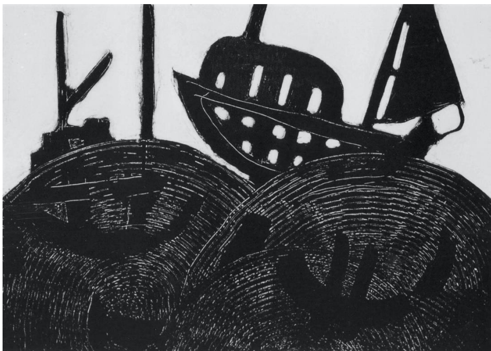
Sjørøvarane. Biletkunst av Sissel Stangenes.