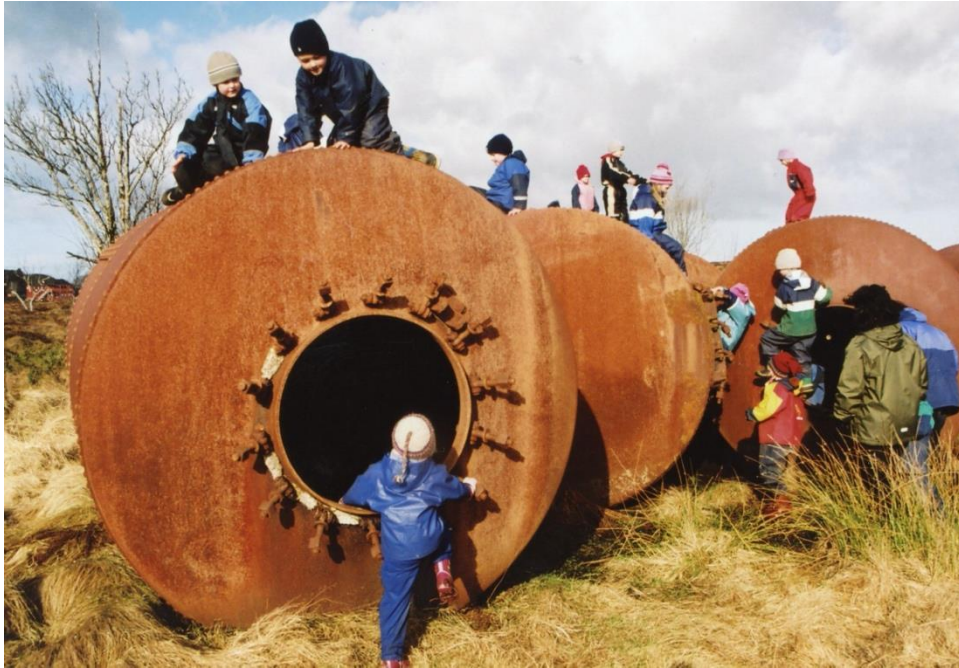
Lokalhistorie er spanande på mange måtar.