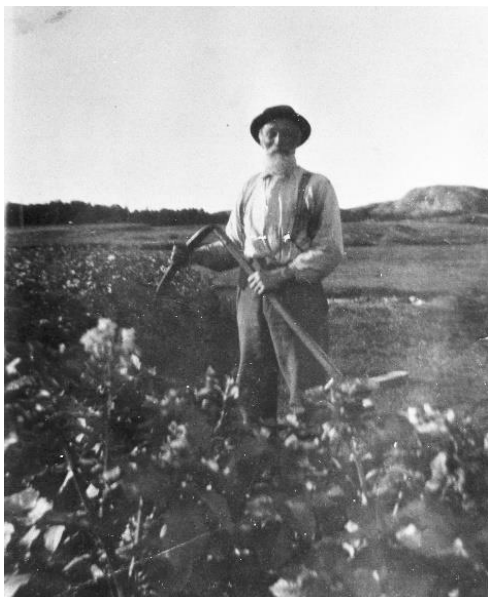
Brukar du ljå, gror det ikkje igjen.