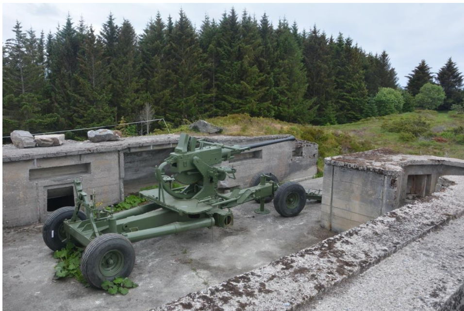
Restaurert kanon.

Storparten av kommunen sine innbyggjarar vart berørte av krigen. Gossen vart okkupert av tyskarane og 7-800 personar blei tvangsevakuert for å gi plass til soldatane. For å sikre skipstrafikken langs kysten og havområdet rundt, trengte tyskarane fleire flyplassar samt ei utbetring av dei få eksisterande norske flyplassane. Den 27.01.41 finn vi dei første dokumenta som fortel at tyskarane har sett seg ut Gossen som stad for denne flyplassen. Våren 1941 blir brukt til ei intens planlegging, og allereie ut på sommaren er utbygginga i full gang.