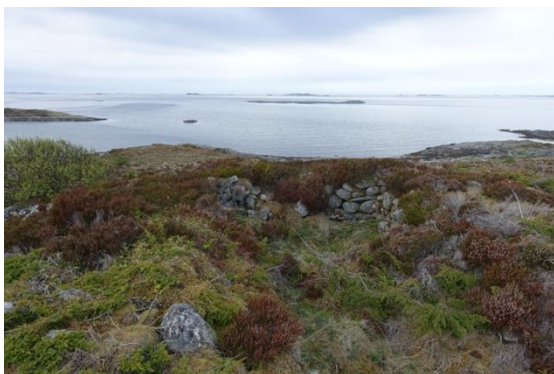
Kyststien - gravrøyser.

Tilrettelegging med mange turstiar har vore prioritert i Aukra kommune, som ein del av tiltak for god folkehelse. Det er både kyststi langs havet og skogssti gjennom til dels gammal skog i Aukraskogen. Begge desse stadene er det kulturminne som gravrøyser og krigsminne. Aukraskogen er også registrert som kulturminne grunna den spesielle historia om planting av skogen. I området ved Kleivhaugen og Purkeneset ligg Ingridsteinen gravfelt, med krigsminne og mange gravrøyser. Fyrlykta på Hoksneset er også endepunkt for ein tursti. På tur mot Ørnehaugen går ein forbi den gamle husmannsplassen Futvika, der hus og fjøs står. Her ligg også staden der det vart funne ei barnegrav ved arkeologiske undersøkingar i samband med bygging av Ormenanlegget. Det er også tursti til Jærmannburet på 99 moh, fjellet på Gossen. I Julsundet er det mellom anna tursti til Fangholsetra, der det er restar av murar frå to fjøs på setra. Kulturminna er fine element i rekreasjonsområda. Mange turstiar går ved kulturminne og i kulturlandskap med spor av aktivitet som har vore. Alle turstiar bidreg på ulike måtar til trivsel og god folkehelse.