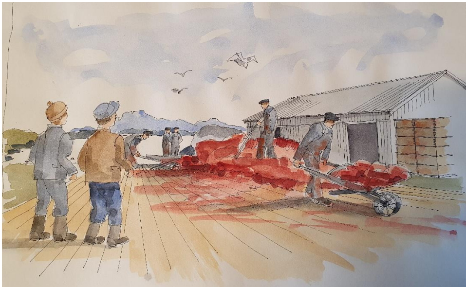
Akvarell: Berge Hjørungnes