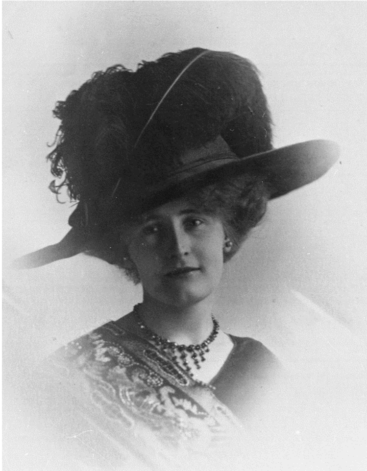
Ein slik skulle ein hatt!