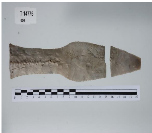
Flintdolke frå Riksfjord.

På Aukra er det funne mange flotte flintdolkar frå siste del av yngre steinalder. Desse er vitnesbyrd om omfattande jordbruk. På Eikrem er det også funne eit større depot av flintgjenstandar frå denne perioden. Funnstaden er merka med informasjonsskilt på ein av kulturstiane nær Ormen-anlegget.