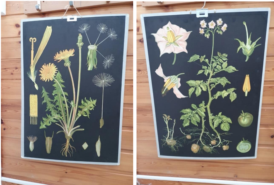
Skoleplansjar frå Breivik skole.