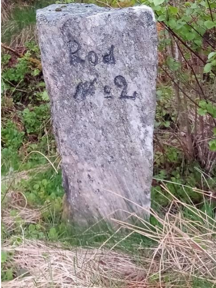
Rodestein i Julsundet.