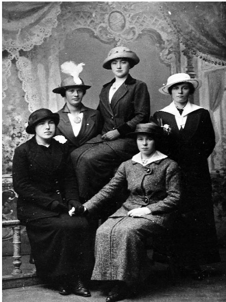
Feiande flotte!

Som i mange andre bygdelag vaks det fram heimeindustri i kjellarar og andre stader i Aukra. Ei tidstypisk utvikling som var prega av både reint naudsarbeid, men òg innovasjon i heile regionen fram til mellomkrigstid og tidleg etterkrigstid. Eit typisk døme på dette var konfeksjonsindustri og skreddarverksemd som ofte vart starta opp i det små, for seinare å vekse til større bedrifter i tråd med etterspurnad etter produkta ein produserte. Innanfor konfeksjon og skreddaryrka vart det etablert fleire bedrifter. Solbakken Konfeksjonsverksted vart satt i drift frå 1936. Grunnleggarane hadde før dette også drive andre stader med konfeksjonsarbeid. På det meste sysselsette verkstaden 126 personar. I november 1943 overtok okkupasjonsmakta verkstaden. I tidleg etterkrigstid vart drifta spesialisert mot kjedesaum og detaljsaum, men denne marknaden minka betydeleg og drifta vart difor avvikla i 1962.