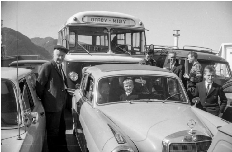
Ferjesambandet Julsundet – Otrøya.