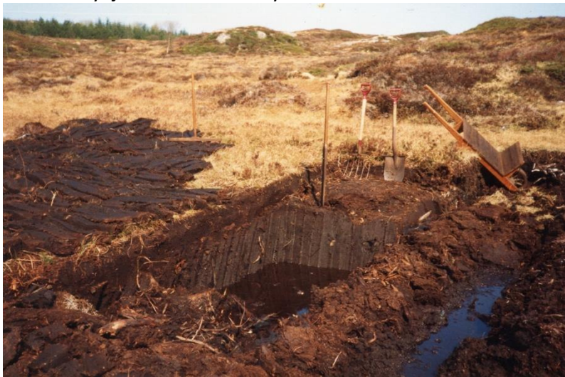
Torvehola, reiskapen og torv til tørk.

Før var torv vanleg å brenne for å få varme i huset. Torv vart spadd frå myrene, og i Aukra var det mykje utmark med myr.