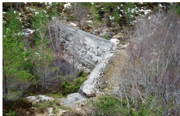
Fangholsetra - murar.