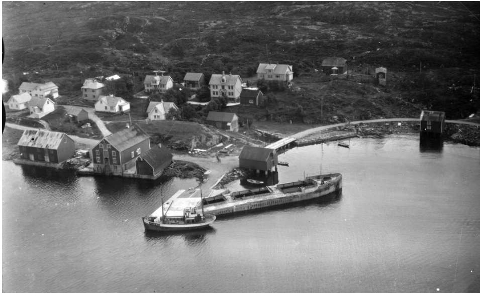
Lekteren Cretecove.

Porsgrunn. Lekteren var i bruk på Aukra av tyskarane i 1943 og vart slepa til kai i Røssøyvågen. Cretecove var lasta med jernbaneskiner og vagger til utbygging av flyplassen og området i Løvika. Lekteren grunnstøytte her og havarerte ved kai under lossing. Utstyr frå lekteren vart berga av Bolsønes verft. Vinsjen om bord vart flytta omkring 1950 og montert i smia til Røssøyvågen Slipp og Mekaniske verksted. Lekteren fekk seinare betongdekke og vart ein del av kaianlegget i hamna i Røssøyvågen.